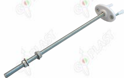
Immagine a puro scopo illustrativo.