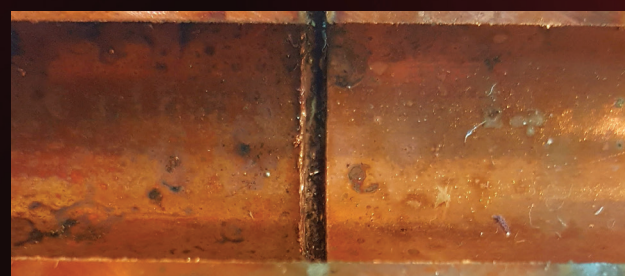
Sopra: linea interna; brasatura con azoto. Sotto: linea interna; brasatura senza azoto.