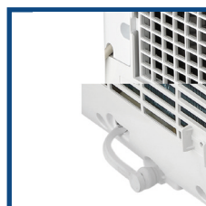
Doppio drenaggio condensa Double condensate draining