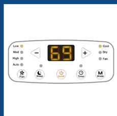
Pannello comandi digitale con display a LED Digital control panel with LED display

Front motorized flaps, with fixed position or automatic vertical swinging.