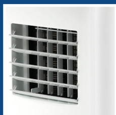
Alette frontali motorizzate Front motorized flaps