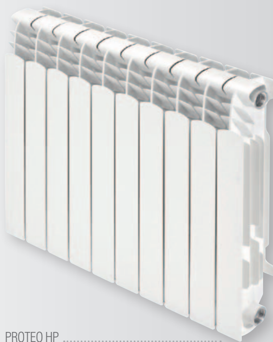
PROTEO HP .....